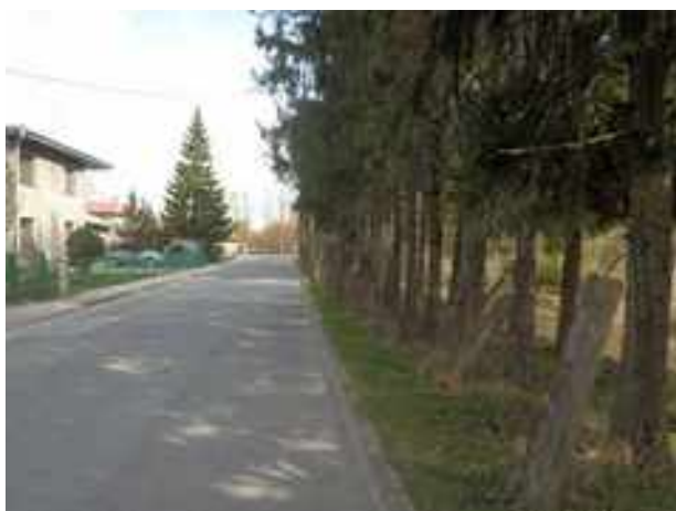
Vaade Raja tänavat pidi