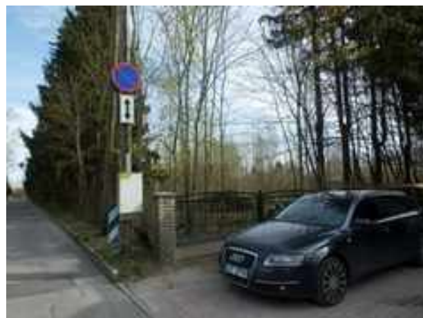
Vaade Savi tänavalt kinnistu edelanurgast